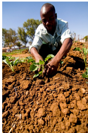
Photo credit: IOM/Will Van Engen Cover photo: IOM/Craig Murphy 2014