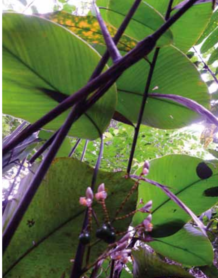
Dans les sous-bois à Marantacées

Ces forêts sont surtout présentes dans la zone alluviale, à proximité des principaux cours d'eau, sur des sols moyennement riches. Elles sont largement dominées par l'espèce Gilbertiodendron dewevrei (Limballi), espèce sempervirente, à bois dense et croissance lente. Leur superficie varie de quelques hectares à quelques centaines d'hectares dans la zone étudiée. Elles présentent une faible diversité arborée et leur productivité est faible. Elles ont été peu perturbées dans le passé et contiennent peu d'espèces pionnières. Dans ces forêts, les fortes perturbations provoquent l'envahissement par des pionnières à courte durée de vie, créant des conditions défavorables au maintien de G. dewevrei . Des perturbations répétées ou trop intenses les conduiraient probablement vers des formations similaires aux forêts à Celtis .