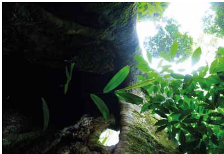
Trouée de lumière dans une forêt à Celtis

Chaque type de forêt possède des caractéristiques qui lui confèrent une résilience différente aux perturbations anthropiques et climatiques. Les vocations attribuées à ces forêts doivent prendre en compte ces différences (Tableau). Les forêts productives à Celtis , développées sur les sols les plus riches, sont résilientes aux perturbations anthropiques : elles sont