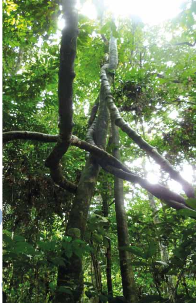
Lianes dans les forêts à Manilkara