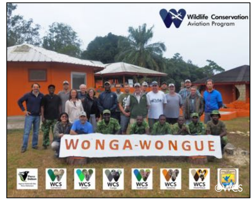
Photo de groupe lors de la réunion régionale du Programme Aviation de WCS à la Réserve Présidentielle de Wonga-Wongué au Gabon.

Création artistique réalisée par les élèves de la Classe Nature à la base de Bomassa.