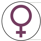
Table ronde axée sur l'Education.